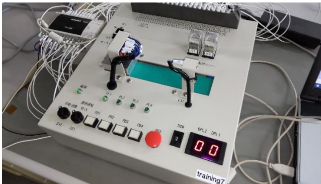
研修で使用する機材