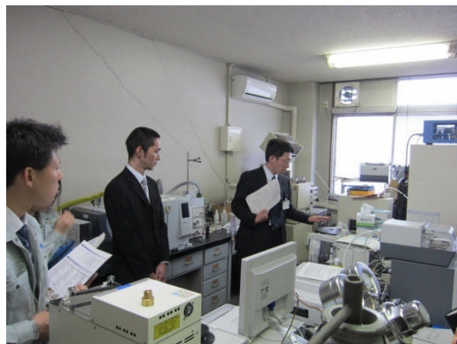
所内見学会の様子