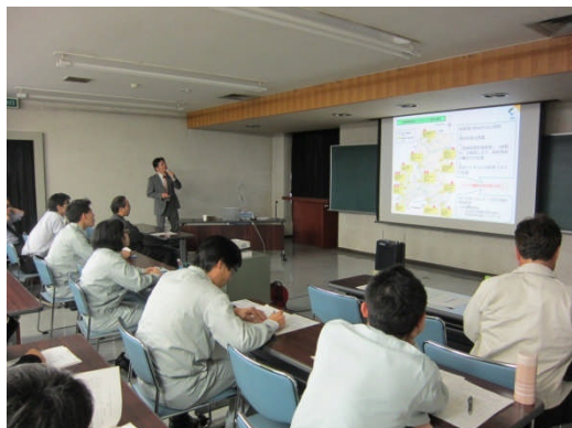
成果発表会の様子

環境・化学部の研究成果発表会・講演会を4月18日(木)に開催しました。外部講師によるゴム・プラスチックの成形加工時・使用時のトラブルと対策に関する講演の他、昨年度実施した研究の成果発表、パネルや成果品の展示、所内見学会を行いました。県内外から49名の方にご参加いただき、発表や展示についての活発な質疑応答や情報交換が行われました。