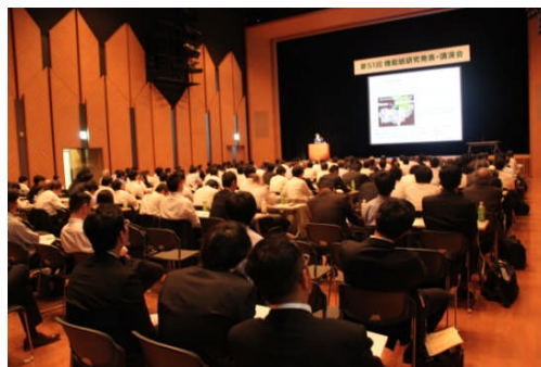
機能紙研究発表・講演会の様子

なお、機能紙研究会は、発表講演会や工場見学会、交流会、関連図書の発行等の活動をしている非営利の学術団体です。機能紙研究会にご興味のある方は、「特定非営利法人 機能紙研究会」のホームページをご覧ください。