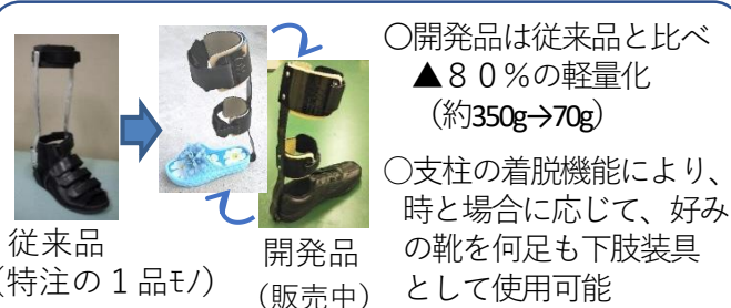
図3 実用化したCFRTP製下肢装具 （図上）脳卒中患者リハビリ用の長下肢装具 （図下）靴に容易に着脱可能な短下肢装具