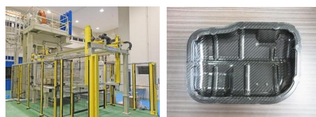
図1 ホットプレスと試作した自動車部品（オイルパン）

この中でも特に 熱可塑性炭素繊維複合材料 (CFRTP) は、材料を加熱すると軟化させることができるため、プレス成形や射出成形等のハイサイクル成形（短い時間で成形）およびリサイクルが可能であり、量産に適しています。当センターでは、関連業界を支援するために、ホットプレスや5軸NC加工機等の加工機、超音波検査装置等の評価機を整備し、県内企業様と共同で自動車部品を試作するなど技術開発・技術支援を進めてきました（図1）。