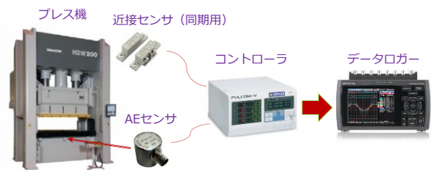
図1 システム全体の概観図

そこで、当センターは、県内企業と共同して、プレス機にセンサを取り付け、工程不良や生産した製品の異常を検知するシステムに関する研究開発を実施しています。工程異常の検出能力を高めるため、県内企業の生産プレス機のデータを取り、データの分析方法や閾値の設定方法を模索しながら研究開発を進めています。図1はシステム全体の外観です。プレス機の異常検知にAE (Acoustic Emission) センサを使用しています。AE センサは、金属の塑性加工時に発生する弾性波を検出する特徴があります。なお、金属から発生する弾性波の共振周波数は150kHzとされ、工程異常の際にはこの付近の共振周波数が発せられるため、共振周波数150kHzと1MHz程度の広帯域幅を有するセンサを使用します。